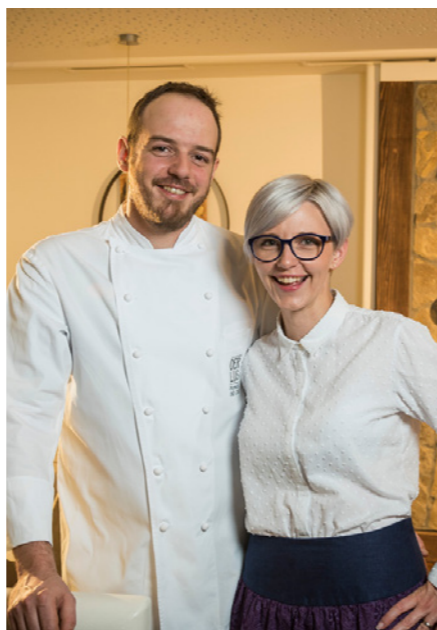
© Der Thaller / Werner Krug